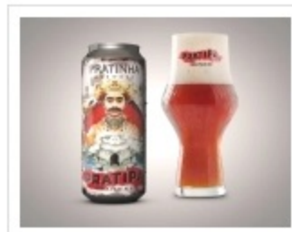
cerveja em lata pratipa