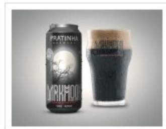
cerveja em lata darkmoon

O design gráfico das embalagens é da Commgroup Branding.